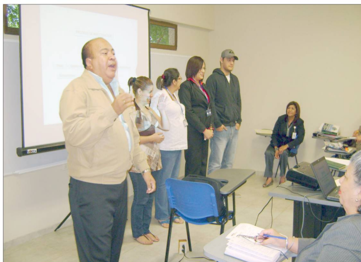
Con ejemplos prácticos el doctor Veliz explicó sus teorías y metodologías para hacer de la investigación un proceso motivador.

tidos por personal altamente calificado, como Introducción al SPSS, que es una aplicación de informática para el procesamiento de datos; Diseño y Validación